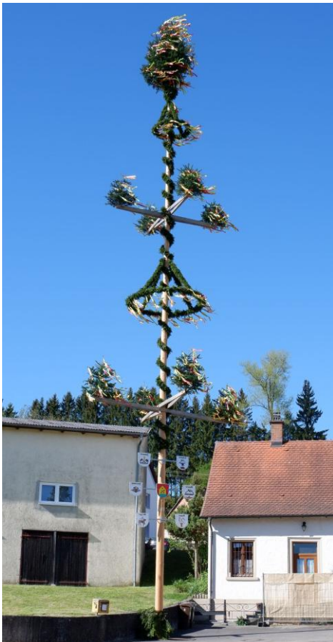
Hausen am Bussen